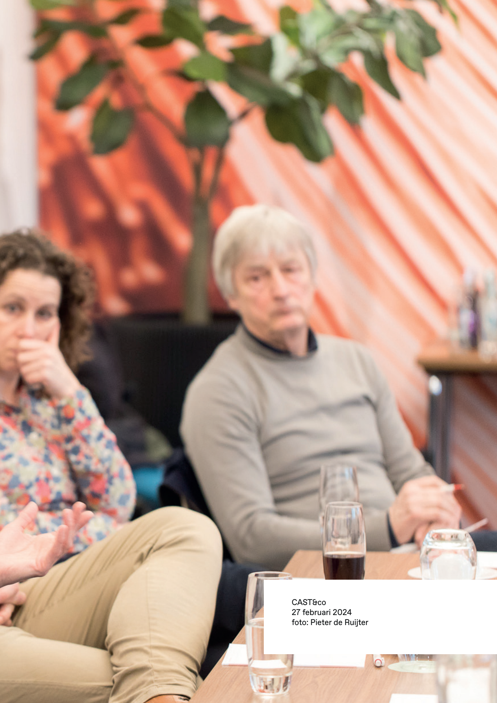
CAST&co 27 februari 2024