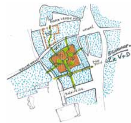
schets van de Hendrikhof

Er is in de afgelopen 200 jaar rondom het Willemsplein een omgeving ontstaan die buitengewoon gelaagd en uniek is. De gebouwen hebben elk een sterke architectuur die stilistisch erg gevarieerd is. De gebouwen staan in een losse, maar interessante verhouding tot elkaar. De kunstwerken in de openbare ruimte zijn een integraal onderdeel van de ruimte van de stad. Dit maakt dat de locatie niet uitwisselbaar is met enige andere plek in ons land!