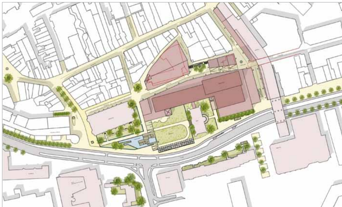
Stedebouwkundige plantekening uit de presentatie van de Concept Stedebouwkundige Visie door ontwerp bureau Rijnbouts

'Ik sta positief tegenover de plannen voor het Hendrikhof en de aanpak van de plint van de Katterug. Hiermee wordt het knusser. De aanpak van de Stadhuisstraat snap ik ook wel,