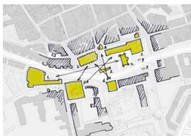
Zichtlijnen en ankerpunten Willemsplein