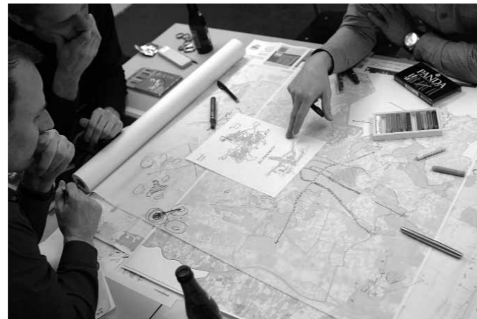
Ontwerpateliers werkten aan toekomstbeelden voor Tilburg.

Hoe ziet Tilburg er uit over 100 jaar? Waar bevinden zich de kracht en identiteit van deze stad en hoe komen deze ruimtelijk tot uiting? Wat is de rol van Tilburg binnen de regio en provincie? Hoe ontwikkelt zich de verhouding tussen bebouwde stad en het groene buitengebied? Donderdag 15 april 2010 organiseerde CAST een discussiebijeenkomst waarbij deze vragen en andere vragen aan de orde kwamen. In de tweede CASTverdieping leest u meer over deze discussie en de toekomstbeelden die gemaakt werden.