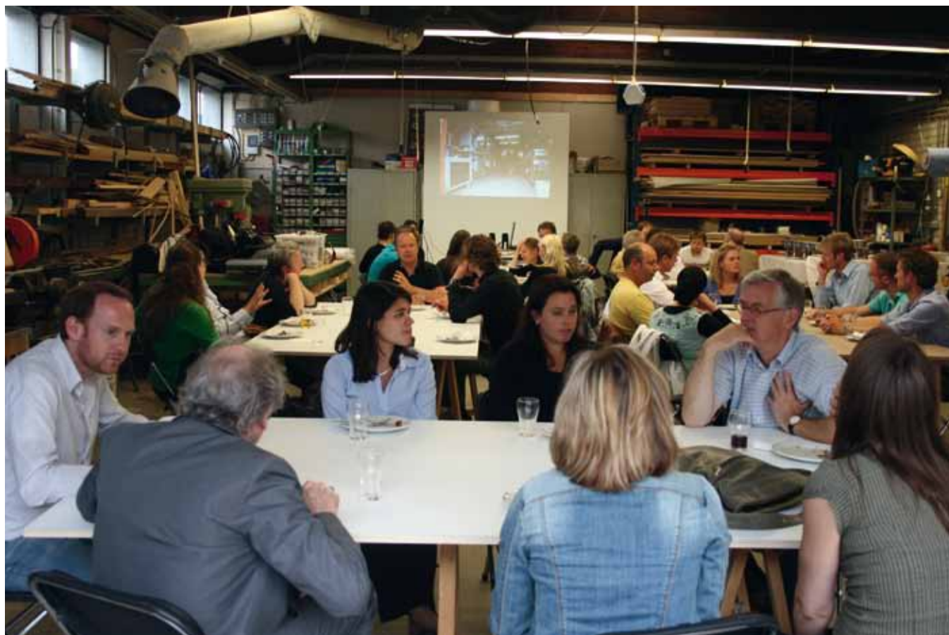
Workshop Wonen en Ondernemen in 't Zand

In goed Tilburgs heet deze herontdekking van de samenleving als bron voor de toekomst 'social innovation'. In de expeditie Tilburg 2020 > 2040 wordt social innovation gezien als de onderscheidende kracht van deze stad. De gelukkige samenloop dat ik deze dag van dromen met experts over 't Zand mocht beleven tegelijk met de start van de expeditie 2020 > 2040, lijkt te bevestigen dat vernieuwing van de samenleving niet alleen het specialisme is van de Universiteit maar tevens stevig wortels heeft in de sociale traditie van de stad.