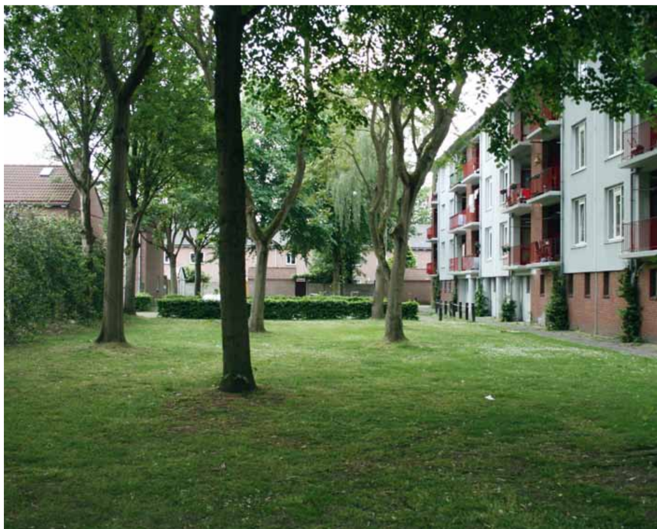
Groene collectieve ruimtes in 't Zand