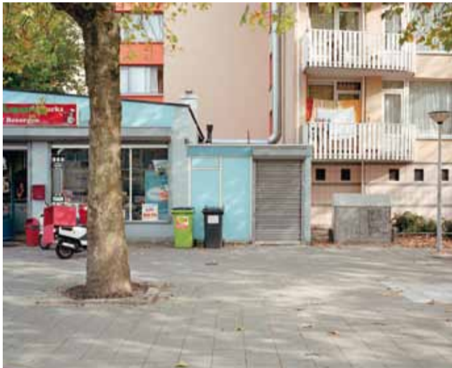
linksboven: Brunostraat Tilburg rechtsboven: Saliehof Tilburg linksmiddelen: Overschie Rotterdam links onder: Nieuw-West Amsterdam rechtsmiddelen en rechtsonder: Stokhasselt Tilburg