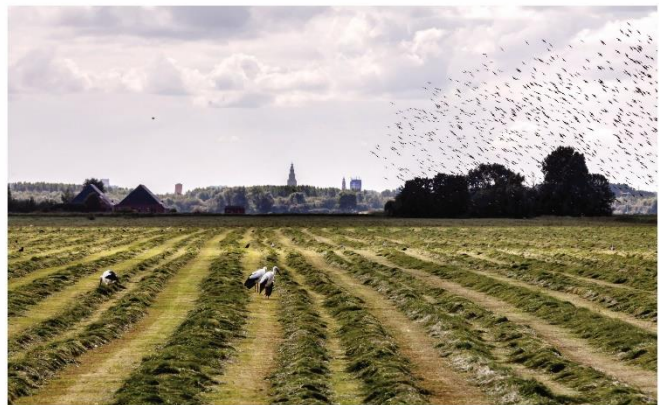
De dorpen door de blik van een passant